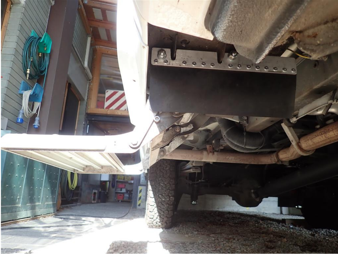
il paraspruzzi montato, gradino estratto