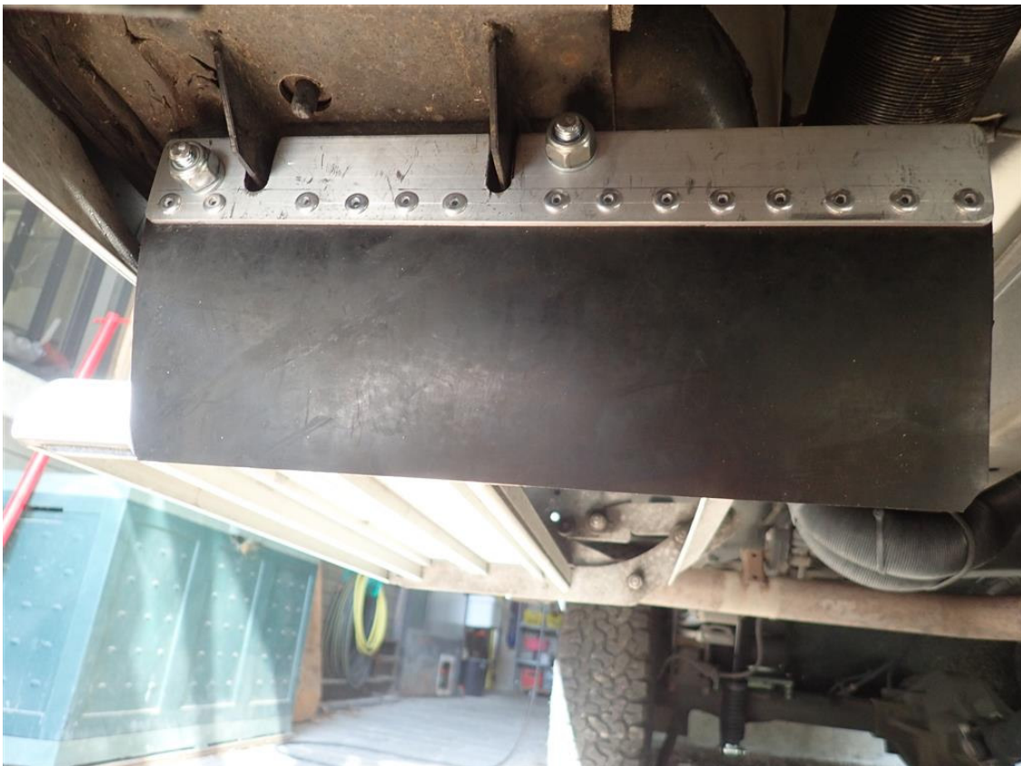
il paraspruzzi montato, gradino represso