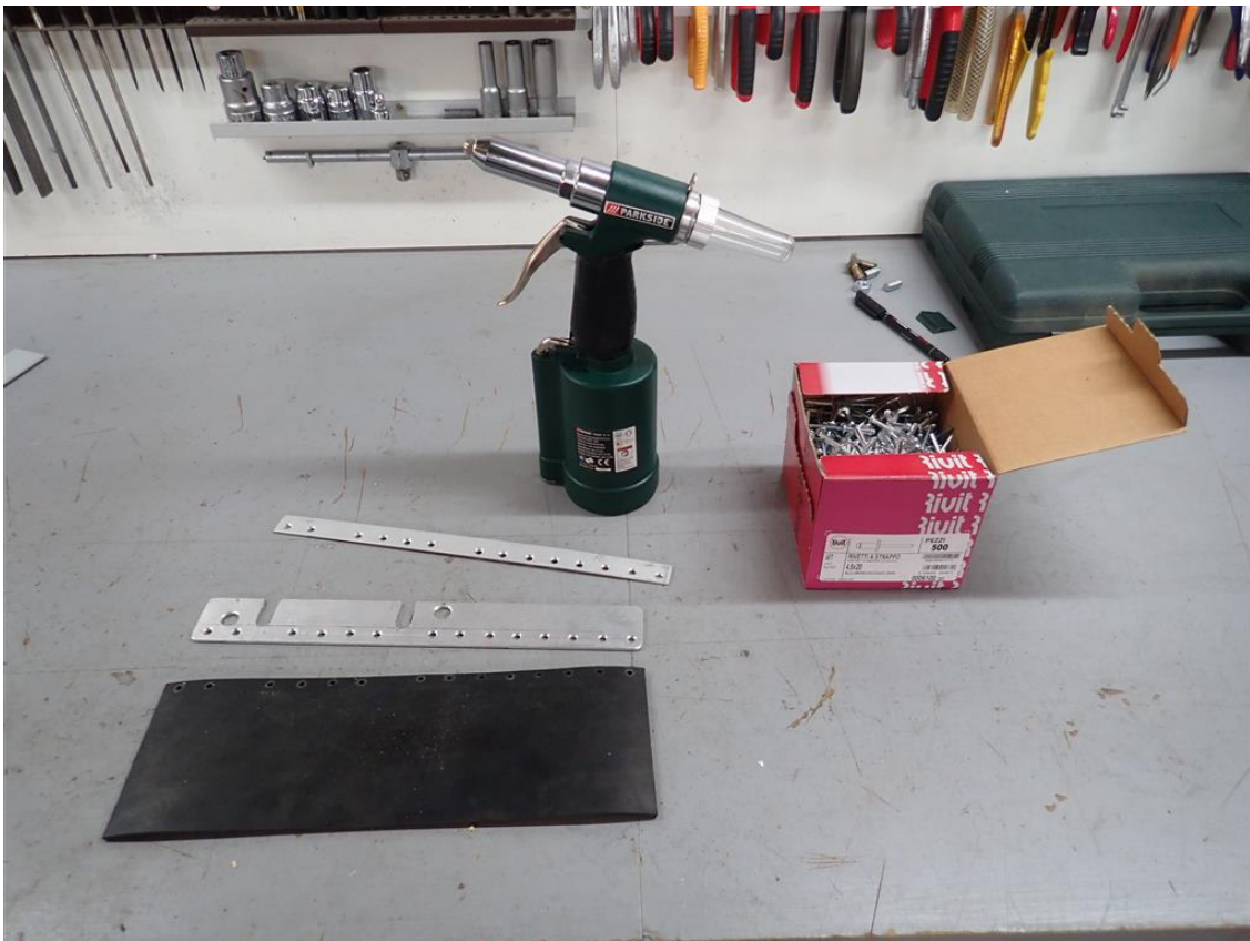
il materiale e attrezzatura necessaria