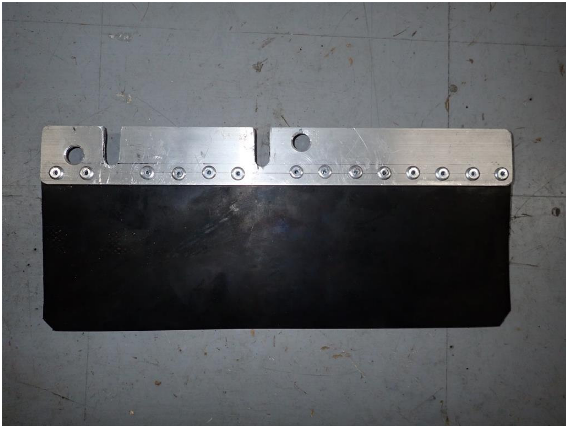
il paraspruzzi finito