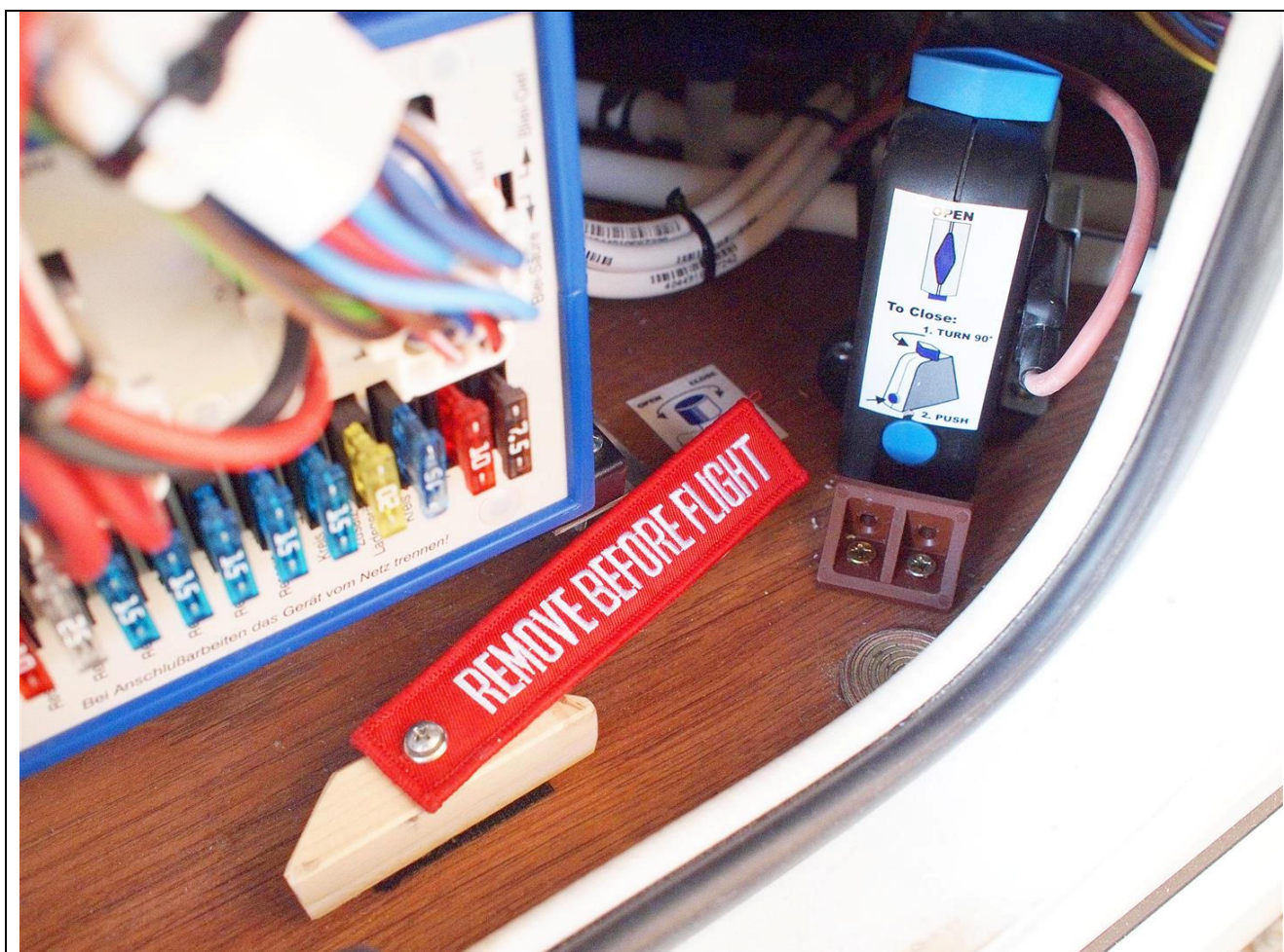
Valvola sbloccata, tasto blu libero.

Prestare molta attenzione a non dimenticarsi mai la valvola bloccata perché in tal caso se la temperatura scendesse sotto lo zero, la caldaia se spenta, potrebbe riportare gravissimi e irreparabili danni da gelo.